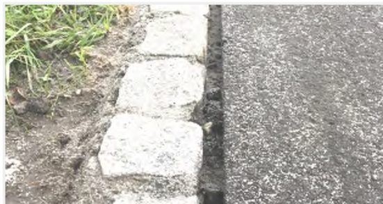
Nach maschineller Reinigung