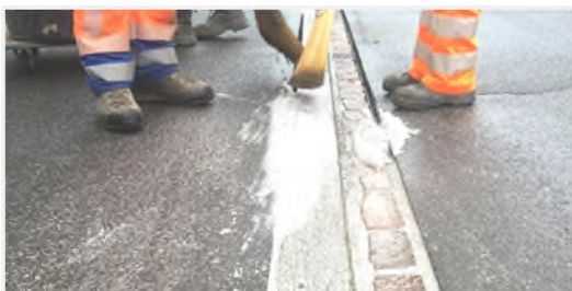
Applikation Primecoat PFM 2-K