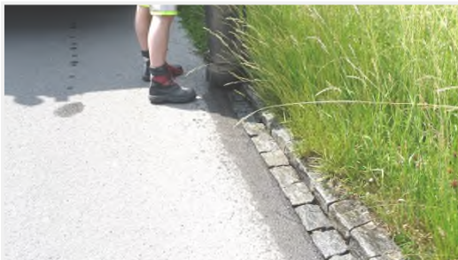
Vor der Reinigung